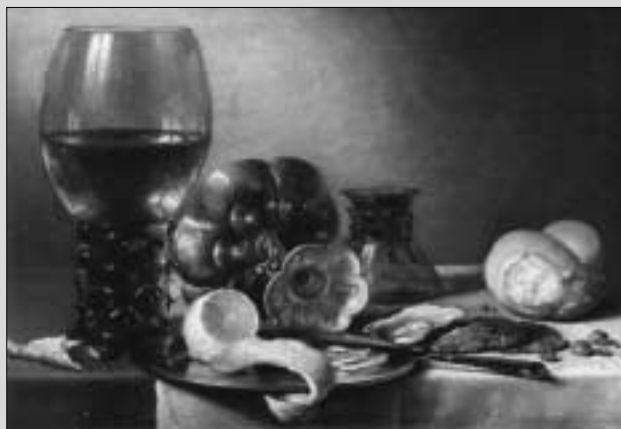
Pieter Claesz: Csendélet (1633), Kassel, Staatliche Kunstsammlungen

A 17. században, a protestáns Hollandiában, a holland festészet virágkorában igen népszerű műfaj volt a csendélet, mely képek nem kizárólag dekoratív berendezési tárgyként szolgáltak, hanem az ábrázolt együttes fontos morális tartalmat közvetített. A lenyűgöző valóság-hűséggel megfestett tárgyakból (üvegpoharakból, hangszerekből, könyvekből), virágokból, gyümölcsökből stb. álló kompozíciók érdekes kettősséggel egyrészt az embert körülvevő csodás, színpompás, érdekes világ darabjait kívánták megörökíteni, másrészt épp ezeken keresztül azt próbálták a korabeli nézőknek sugallni, hogy a túlvilági örök élethez képest ez a földi élet mu-